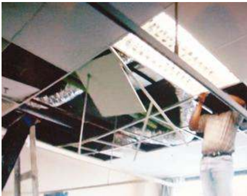
Hospital Sultan Abdul Halim