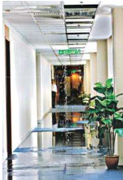
Ibu pejabat Imigresen