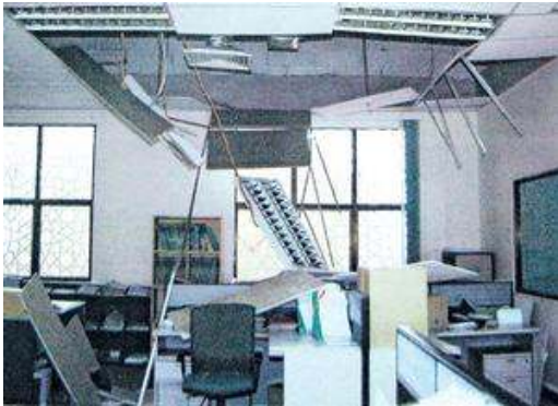
Mahkamah Syariah Johor